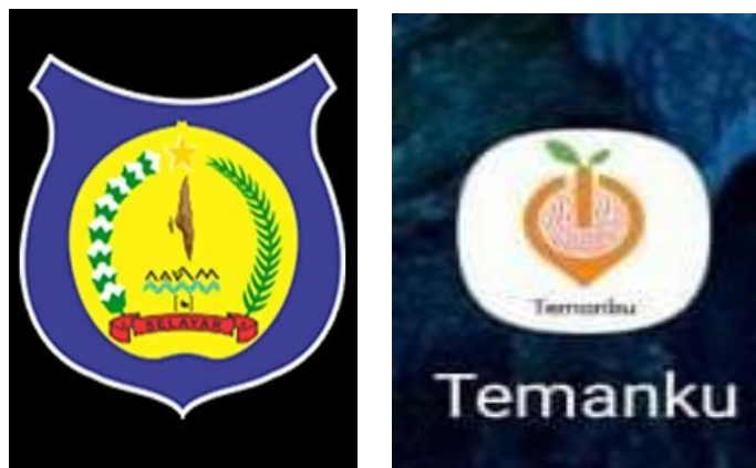
Gambar 1 Aplikasi Absensi Online

Gambar pertama adalah gambar aplikasi yang digunakan pada tahun 2022, saat awal-awal melakukan absensi online tapi tidak berjalan dengan lama aplikasi